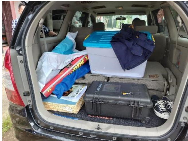
Gambar 4. Sarana dan prasarana dalam pelaksanaan Eazy Passport

Tangibles atau bukti fisik dalam penyediaan layanan, infrastruktur, ketersediaan peralatan, kedisiplinan staf, kemudahan memperoleh atau mengkomunikasikan informasi dan komunikasi dalam memberikan pelayanan publik.