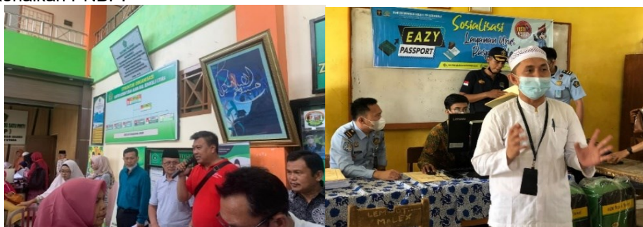
Gambar 2. Sosialisasi Layanan Eazy Passport