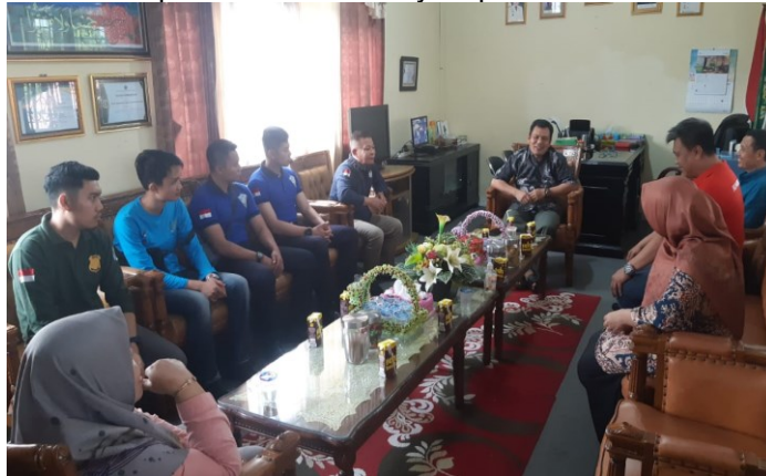
Gambar 6. Diskusi Bersama Kepala Kantor Kementerian Agama Bengkulu Utara Terkait Kegiatan Pelaksanaan Layanan Eazy Passport

Selanjutnya tanggapan dari pemohon yang hadir juga mengapresiasi atas kegiatan Layanan Eazy Passport tersebut karena sangat meringankan dan memudahkan mereka untuk menerima layanan keimigrasian dalam hal pembuatan paspor. Disampaikan juga bahwa kedepannya dan seterusnya akan adanya kerjasama antara instansi Kementerian Agama Bengkulu Utara dengan Kantor Imigrasi Kelas I TPI Bengkulu agar kegiatan ini dapat menjadi rutin. Dalam hal ini telah terbentuk rasa percaya terhadap pelayanan yang diberikan dan bahkan minta adanya rutinitas kegiatan Layanan Eazy Passport yang dinilai dapat memberikan rasa kepuasan dalam melayani pemohon.