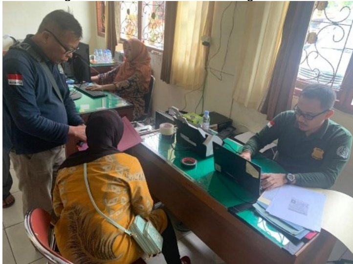
Gambar 7. Pelaksanaan Layanan Eazy Passport Pelaksanaan Layanan Eazy Passport Kantor Imigrasi Kelas I TPI Bengkulu

Empati atau rasa peduli dan perhatian yang di berikan pegawai imigrasi terhadap masalah yang dihadapi pemohon. Karena dengan adanya suasana positif dari pemohon yang diberikan perhatian dan dihargai lebih melalui kinerja pegawai akan meningkatkan kualitas dari Kantor Imigrasi.