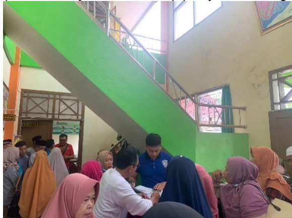
Gambar 5. Pengarahan Pada Saat Pelaksanaan Eazy Passport

Ketanggapan petugas imigrasi dalam memberikan layanan ketika melayani dan membantu pemohon yang memiliki kesulitan dalam memenuhi persyaratannya serta memiliki kesigapan dalam merespon setiap kebutuhan pemohon. Layanan Eazy Passport yang dilaksanakan pada Kantor Imigrasi Kelas I TPI Bengkulu mayoritas pemohonnya adalah para lansia yang terkadang sudah susah menangkap arahan yang diberikan dan dalam menjalankannya. Dalam pelaksanaannya di lapangan selalu ada petugas yang membantu dan menggiring para pemohon yang merasa bingung dan kesusahan dalam mengisi formulir ataupun perihal yang disiapkan sebelum melakukan foto dan wawancara. Dengan memberikan pelayanan yang ramah serta komunikatif ini diharapkan dapat terciptanya kepuasan masyarakat terhadap pelayanan keimigrasian.