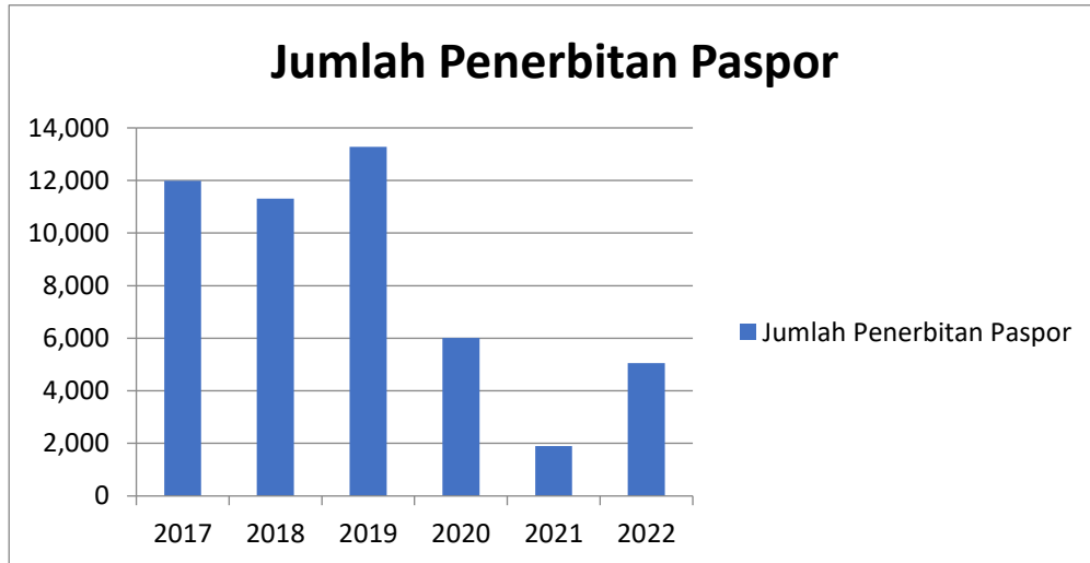
Tabel 1. Diagram Data Penerbitan Paspor pada Kantor Imigrasi Kelas III Non-TPI Kotabumi Tahun 2017-Juli 2022