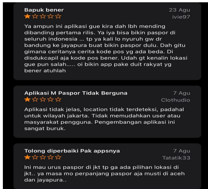
Gambar 3. Keluhan Masyarakat terkait Aplikasi M-paspor

M-Paspor merupakan aplikasi baru dari Direktorat Jenderal Imigrasi dan aplikasi ini merupakan wujud baru dari Aplikasi Pendaftaran Antrian Paspor Online (APAPO). Pembaruan aplikasi M-Paspor ini diharapkan agar dapat membantu jalannya pelayanan permohonan paspor dengan waktu yang lebih singkat, lebih cepat, lebih akuntabel dan lebih transparan. Aplikasi ini dibuat untuk memudahkan pegawai imigrasi untuk mempercepat pelayanan keimigrasian, namun karena aplikasi ini masih terbilang aplikasi yang baru sehingga aplikasi ini masih sering terjadi error dan masih membutuhkan beberapa perbaikan. Hal ini dapat dibuktikan dari ulasan aplikasi M-Paspor di Google Play dan App Store melalui tangkapan layar sebagai berikut :