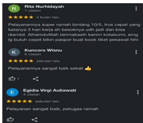
Gambar 2. Ulasan Baik Dari Masyarakat

Berdasarkan hasil penelitian, pegawai pada Kantor Imigrasi Kelas III Non-TPI Kotabumi telah dapat memberikan pelayanan yang sangat baik dan ramah. Hal ini dapat dibuktikan dengan beberapa ulasan yang terdapat di laman Web milik Kantor Imigrasi Kelas III Non-TPI Kotabumi sebagai berikut: