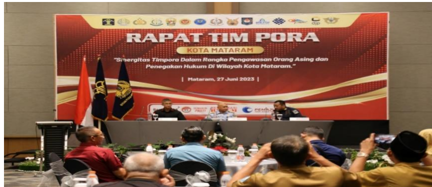
Gambar 1.3 Rapat Kerjasama TIMPORA

tetapi juga pada pertukaran informasi yang penting dalam keamanan nasional dan penindakan Keimigrasian. Dengan berbagai data dan analisis, kolaborasi memungkinkan seksi intelijen dan penindakan Keimigrasian untuk memahami konteks yang lebih luas dan merencanakan tindakan yang lebih baik.