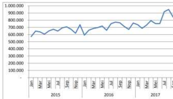
Gambar 2. Grafik kenaikan wisatawan mancanegara pasca kebijakan BVK

Adapun Indonesia sendiri juga menerapkan aturan bebas visa kunjungan kepada beberapa negara. Berdasarkan penelitian yang dilakukan oleh Wulandari (2017) yang menguji efektivitas penerapan bebas visa kunjungan terhadap kedatangan wisatawan mancanegara, diperoleh grafik sebagai berikut: