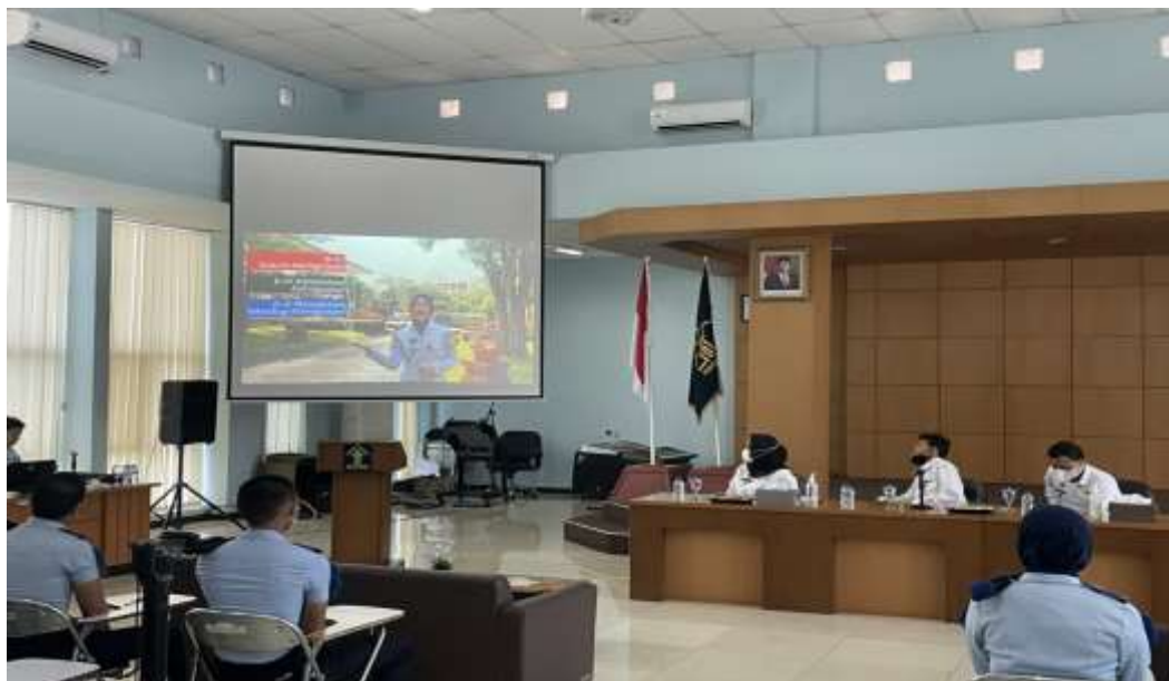
Gambar 2. Taruna Politeknik Imigrasi menjelaskan prodi yang ada di Politeknik Imigrasi