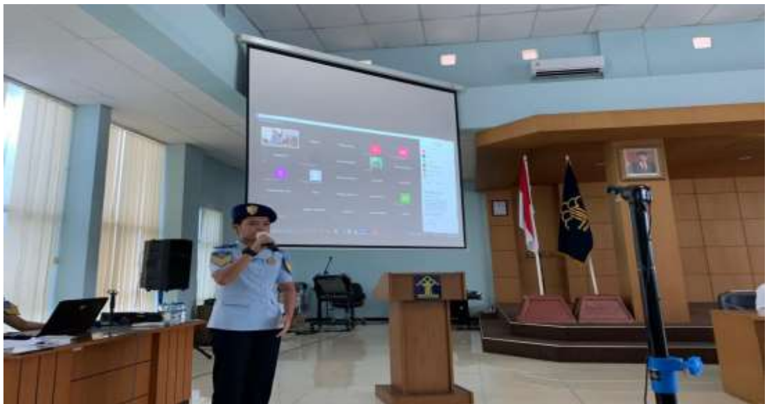
Gambar 4. Taruna Politeknik Imigrasi melakukan sesi tanya jawab dalam sosialisasi