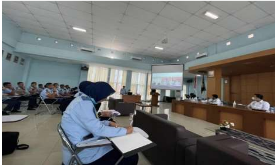
Gambar 1. Taruna Politeknik Imigrasi memutar video profil Politeknik Imigrasi

dengan pembatasan maksimal 5 penanya. Setelah kegiatan sosialisasi diadakan, taruna Politeknik Imigrasi melanjutkan kegiatan pembagian masker kepada masyarakat yang berada di wilayah sekitar Kantor Imigrasi Kelas I TPI Bandar Lampung.