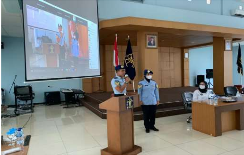
Gambar 3. Taruna Politeknik Imigrasi berbagi pengalaman tes masuk Politeknik Imigrasi