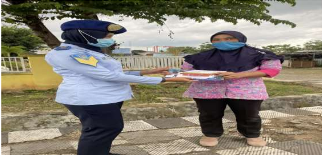
Gambar 5. Taruna Politeknik Imigrasi membagikan masker kepada masyarakat