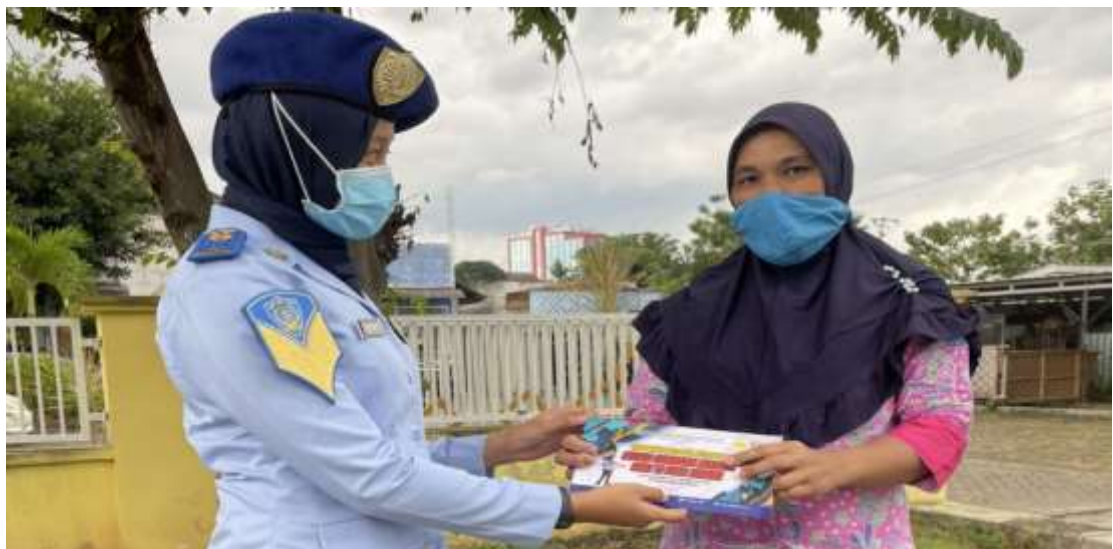
Gambar 7. Taruna Politeknik Imigrasi berbagi masker kepada masyarakat