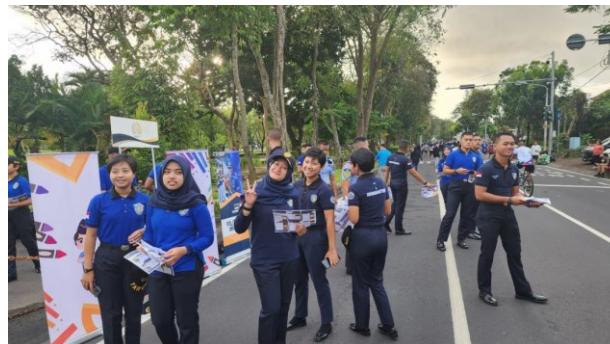
Gambar 2. Pemberian Informasi Terkait Sosialisasi Peraturan dan Prosedur Imigrasi oleh Kantor Imigrasi Kelas I TPI Denpasar

mengalami proses ini. Hasil penelitian ini akan memberikan wawasan yang berharga untuk meningkatkan efektivitas proses sosialisasi dan memahami kebutuhan serta harapan masyarakat dalam konteks imigrasi.