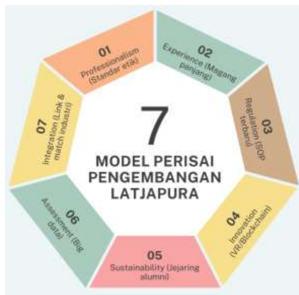
Gambar 3. Model PERISAI Pengembangan Latjapura

Berdasarkan temuan lapangan, kami mengusulkan model PERISAI untuk program selanjutnya: