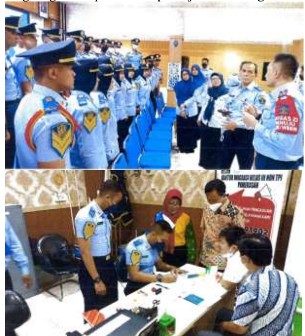
Gambar 1. Pelaksanaan Latjapura

Program Latjapura di Kantor Imigrasi Malang dirancang sebagai media transformatif bagi taruna Politeknik Imigrasi (Poltekim) untuk mengalami langsung kompleksitas pekerjaan keimigrasian.