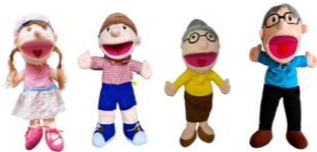
Gambar 4. Boneka Tangan yang Akan Diperankan

Dalam tahap ini, dilakukan identifikasi masalah terkait rendahnya pemahaman dan internalisasi nilai-nilai Pancasila pada anak-anak usia dini dari latar belakang keluarga ekonominya kurang mampu serta lingkungan sosial yang minim edukasi karakter. Data diperoleh melalui koordinasi dengan sekolah dan tokoh komunitas.