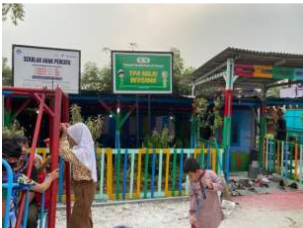
Gambar 1. Lokasi Sekolah Anak Percaya

Dalam konteks tersebut, penguatan nilai-nilai Pancasila sejak dini menjadi sebuah keniscayaan untuk memastikan terwujudnya generasi yang berkarakter dan beridentitas nasional kuat. Kegiatan pengabdian masyarakat dengan tema Menanamkan Nilai-Nilai Pancasila, Menuju Generasi Emas Indonesia 2045 yang dilaksanakan di Sekolah Anak Percaya, Kelurahan Srengseng, Kembangan, Jakarta Barat, merupakan upaya strategis untuk menjembatani kesenjangan edukasi serta menanamkan nilai-nilai dasar berbangsa dan bernegara kepada anak-anak dari keluarga kurang mampu. Kegiatan ini dilatarbelakangi oleh permasalahan rendahnya akses pendidikan formal dan kurang optimalnya penanaman nilai-nilai Pancasila di kalangan anak-anak pemulung dan keluarga kurang mampu di wilayah tersebut. Selain kendala ekonomi dan status administrasi, ketidakterpenuhinya pendidikan inklusif yang memadukan aspek akademik dan karakter menjadi hambatan utama dalam membentuk generasi yang berdaya saing dan berkarakter nasionalisme tinggi.