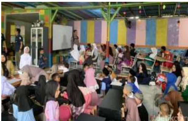
Gambar 2. Suasana Belajar Sekolah Anak Percaya

Srengseng. Melalui program ini, diharapkan dapat terbentuk karakter dan identitas nasional yang kuat dengan menekankan pendidikan inklusif berbasis komunitas.