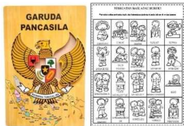
Gambar 5. Puzzle Garuda Pancasila & Lembar Kerja Siswa

Tahap pelaksanaan berlangsung dengan menggerakkan metode partisipatif dan interaktif. Anak-anak terlibat langsung dalam kegiatan pembelajaran nilai Pancasila melalui media yang sudah disiapkan. Penggunaan drama boneka yang mengangkat nilai persatuan, gotong royong, dan toleransi sangat membantu mereka memahami konsep nilai yang abstrak menjadi lebih konkrit dan mudah diterima.