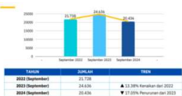
Gambar 1. Jumlah Penempatan PMI

Jumlah lapangan kerja di dalam negeri yang tidak sebanding dengan jumlah banyaknya angkatan kerja yang tersedia, membuat penduduk Indonesia berusia produktif berbalik arah dan mencari peluang di negara lain yang dianggap lebih menjanjikan. Berdasarkan laporan Data Penempatan dan Perlindungan Pekerja Migran Indonesia yang dikeluarkan Pusat Data Informasi pada Badan Perlindungan Pekerja Migran Indonesia (BP2MI) pada periode bulan Januari sampai September 2024 diketahui bahwa penempatan Pekerja Migran Indonesia (PMI) terjadi secara fluktuatif dalam tiga tahun terakhir.