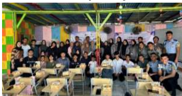
Gambar 5. Foto Bersama

Di akhir sosialisasi, seluruh peserta diajak untuk melakukan refleksi terbuka guna menilai sejauh mana pemahaman mereka terhadap risiko dan prosedur penempatan PMI secara ilegal telah berkembang. Komitmen peserta terhadap pencegahan TPPO juga dikonfirmasi melalui sesi tanya-jawab yang dipandu oleh tim dosen jurusan keimigrasian. Sebelumnya, dilakukan pre-test dan post-test singkat untuk memetakan perubahan tingkat pemahaman peserta, terutama terkait bahaya jalur migrasi non-prosedural serta pentingnya kesadaran hukum dalam proses migrasi.