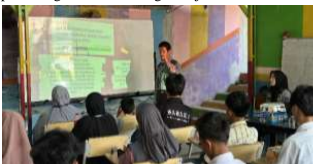
Gambar 4. Pemaparan Materi

Sebaliknya, jalur ilegal ditandai oleh keterlibatan calo atau agen tidak resmi yang menawarkan iming-iming penghasilan tinggi tanpa pelatihan dan kontrak kerja. Para calon PMI diberangkatkan menggunakan dokumen palsu atau visa kunjungan, yang menjadikan mereka rawan terhadap pemerasan, eksploitasi, serta tidak memiliki akses terhadap perlindungan hukum di negara tujuan.