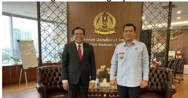
Gambar 2: Hubungan Diplomatik RI Dengan Kazakhstan Dalam Pemberian VoA Sumber: Rakyat Merdeka 2023

Perlindungan sosial mencakup bantuan bagi WNI yang mengalami kesulitan ekonomi di luar negeri. Pemerintah berkomitmen untuk memberikan bantuan sosial, baik dalam bentuk bantuan keuangan maupun bantuan lainnya, guna mendukung WNI yang menghadapi kesulitan ekonomi di negara tempat tinggal mereka. Pemulangan WNI yang bermasalah juga merupakan bentuk perlindungan sosial, di mana pemerintah berupaya mengamankan kepulangan WNI yang menghadapi tantangan serius di luar negeri. Dengan demikian, perlindungan terhadap WNI di luar negeri melibatkan serangkaian tindakan yang mencakup aspek hukum, fisik, dan sosial. Upaya ini menggambarkan komitmen pemerintah untuk menjaga kesejahteraan dan hak-hak WNI di manapun mereka berada, mencerminkan hubungan yang kuat antara negara dan warganya di kancah internasional.