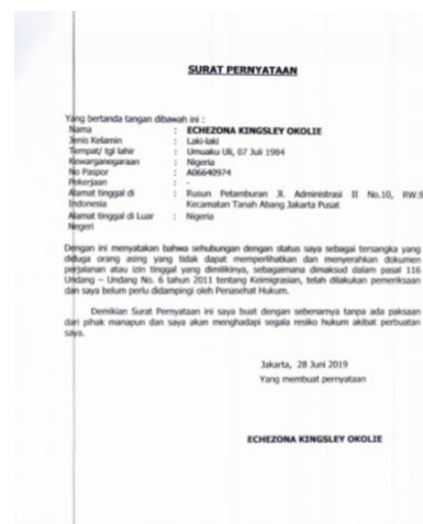
Gambar 2. Surat Pernyataan Tersangka

Echezona Kingsley Okolie tidak dapat menunjukan dan memberi tahu siapa sponsor/penjamin nya pada saat kedatangannya ke Indonesia. Ia tidak dapat mendatangkan saksi yang mengunggulkannya.