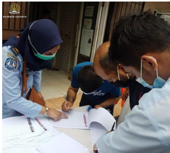
Gambar 3 pengawasan terhadap pengungsi di Community House Paramount Dormitory Serpong

RUDENIM Jakarta yaitu melakukan absensi dan pendataan pada Kartu Tanda Pengungsi dengan peneraan stempel dan tanda tangan petugas RUDENIM Jakarta 21 .