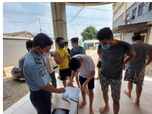
petugas RUDENIM Jakarta menerakan cap/ stempel