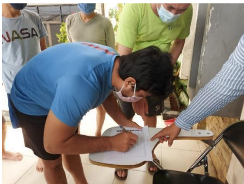
pengungsi melakukan absensi