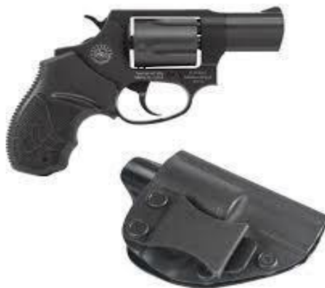
Gambar 1 Taurus 85

Home Team Academy of Singapore adalah tempat pelatihan lanjutan bagi organisasi Kementerian Dalam Negeri di Singapura, termasuk Singapore Police Officer , the Singapore Civil Defence Force dan Immigration Checkpoint Authority (ICA) . Tujuan pembentukan HTA adalah untuk memfasilitasi pelatihan dan pengetahuan dari masing-masing lembaga dalam ruang lingkup Ministry Home Affairs of Singapore serta mengembangkan kemampuan dan keterampilan khususnya di bidang keamanan negara. Dilansir pada laman Home Team Academy of Singapore bahwa ada empat program dalam pelatihan tersebut, salah satunya adalah Immigration Checkpoint Authority Training Command (ICATC) . ICATC adalah pelatihan yang berkualifikasi kepada petugas ICA untuk membekali petugas dengan keterampilan, keahlian dan kemampuan memimpin suatu unit. 17